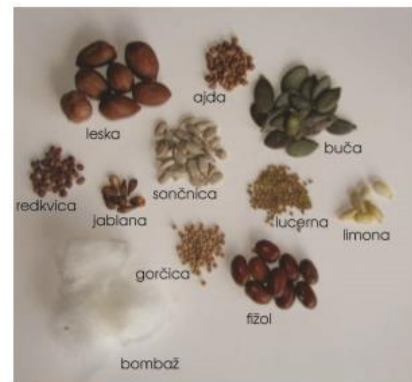
Semena različnih rastlinskih vrst so raznih oblik, barv in velikosti.