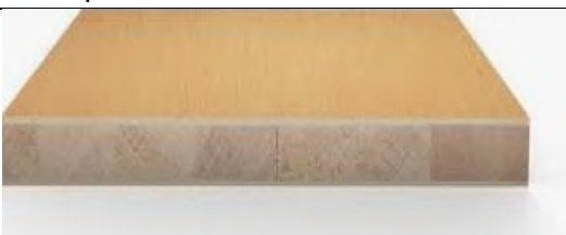
panelna plošča- mize v učilnici TIT