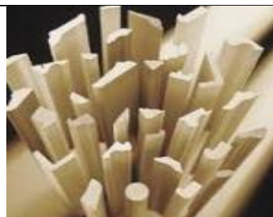
letve različnih oblik