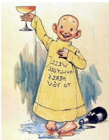
Slika 1: Yellow Kid

Razvoj stripa sovпада z nastankom filma. Medija vplivata drug na drugega.